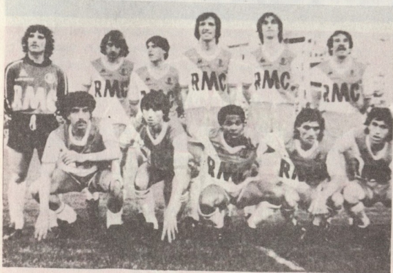
Отборът на „Монако“

Класирания във Френското първенство през последните 10 години: 1972—19, 1973—2 във II див., 1974—16, 1975—10, 1976—18, 1977—1 във II див., 1978—1, 1979—4, 1980—4, 1981—4, 1982—1.